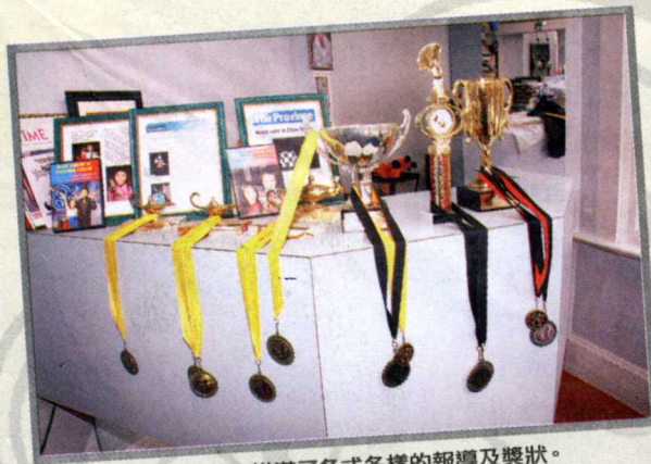
▲狹窄的辦公室內掛滿了各式各樣的報導及獎狀。

小，近距離的魔術就比較難做。所以我通常建議他們在舞台上表演大型魔術，這種表演只要將道具準備好、用心練習就可以很好看，而且距離很遠的觀眾也看得很清楚，現在他們已經學會在舞台上切開媽媽的身體。」